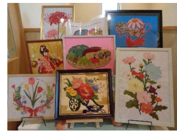
島守 タノ 様