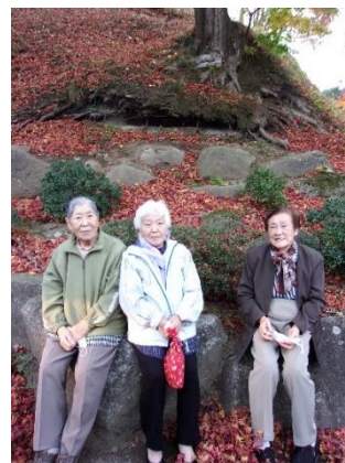
寺下観音周辺にて